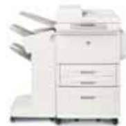
HP LaserJet 9040/9050mfp avec bac d'empilement et agrafeuse

Empile jusqu'à 3 000 feuilles de papier avec décalage des tâches.