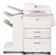
HP LaserJet 9040mfp avec bac d'empilement optionnel

Simplifiez vos processus de communication d'entreprise avec des fonctionnalités abordables et performantes d'impression, de copie et de numérisation jusqu'en A3, de numérisation vers e-mail, de finition de document, de télécopie 1 et de communication numérique 2 en option pour les groupes de travail et services exigeants.