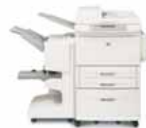
HP LaserJet 9040/9050mfp avec finisseur multifonction

Fournit des capacités d'empilement de 3 000 feuilles et d'agrafage multiposition pour jusqu'à 50 feuilles par tâche.