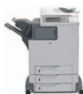
HP Color LaserJet 4730xs mfp