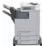
HP Color LaserJet 4730xm mfp